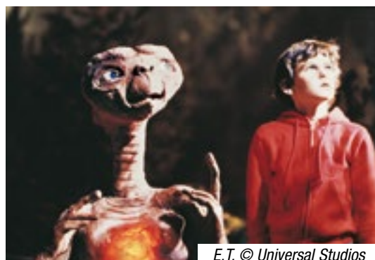
E.T. © Universal Studios

Théâtre de la Fleuriaye Saison 19-20 Abonnements ouverts à tous à partir du 7/06 theatre-carquefou.fr