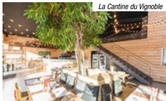
La Cantine du Vignoble