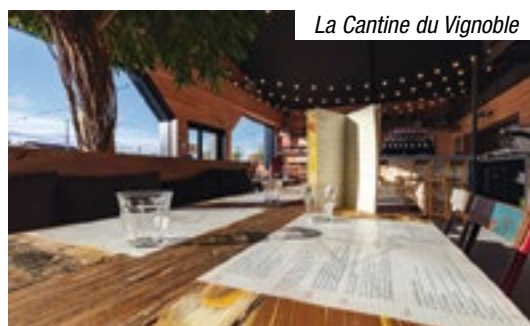
La Cantine du Vignoble

20 rue de l'atlantique à Basse-Goulaine lacantineduvignoble.fr / 02 40 04 65 66