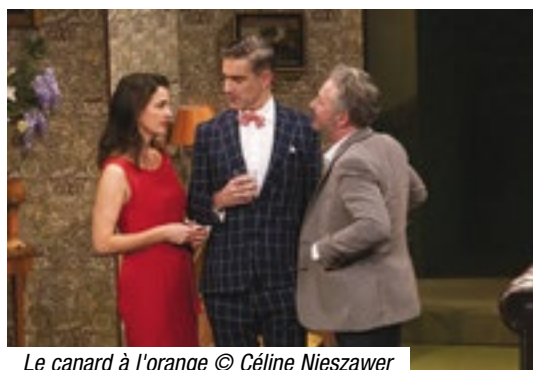
Le canard à l'orange

3 3.000 spectateurs ont passé les portes du Théâtre de la Fleuriaye sur la saison 2018-2019. Ce bilan est, par conséquent, l'un des meilleurs du département. Avec ses 6000 abonnés, le Théâtre maintient sa base de fidèles. A partir du 7 juin, les abonnements et la billetterie sont ouverts à tous et cette année, les prix varient en fonction du placement, une nouveauté nécessaire ! De Stomp au Canard à l'Orange nommé 7 fois aux Molières 2019 (une récompense), la saison s'annonce d'ores et déjà excitante à Carquefou !