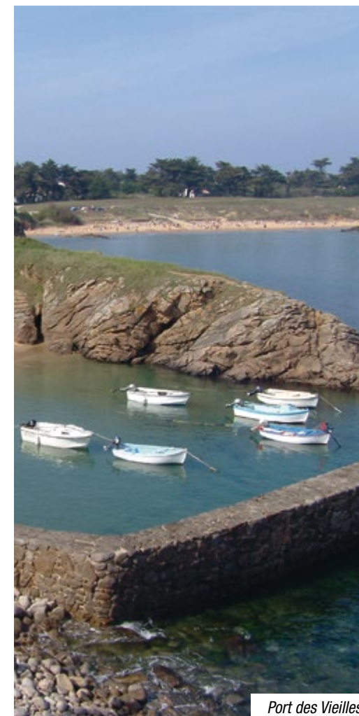
Port des Vieilles

Commençons par la côte typiquement vendéenne avec ses longues plages de sable blond et ses forêts de cyprès. Idéal par se doré au soleil et profiter d'une eau fraîche et limpide.