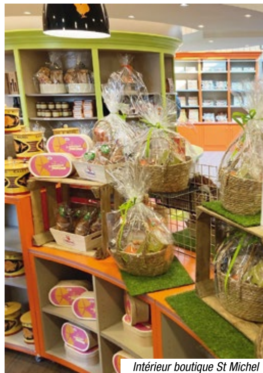
Intérieur boutique St Michel

E n ce dimanche matin de printemps, nous vous emmenons faire un tour à la boutique St Michel à Saint-Michel Chef-Chef, un lieu plein de saveurs et d'images qui rappellent notre enfance !