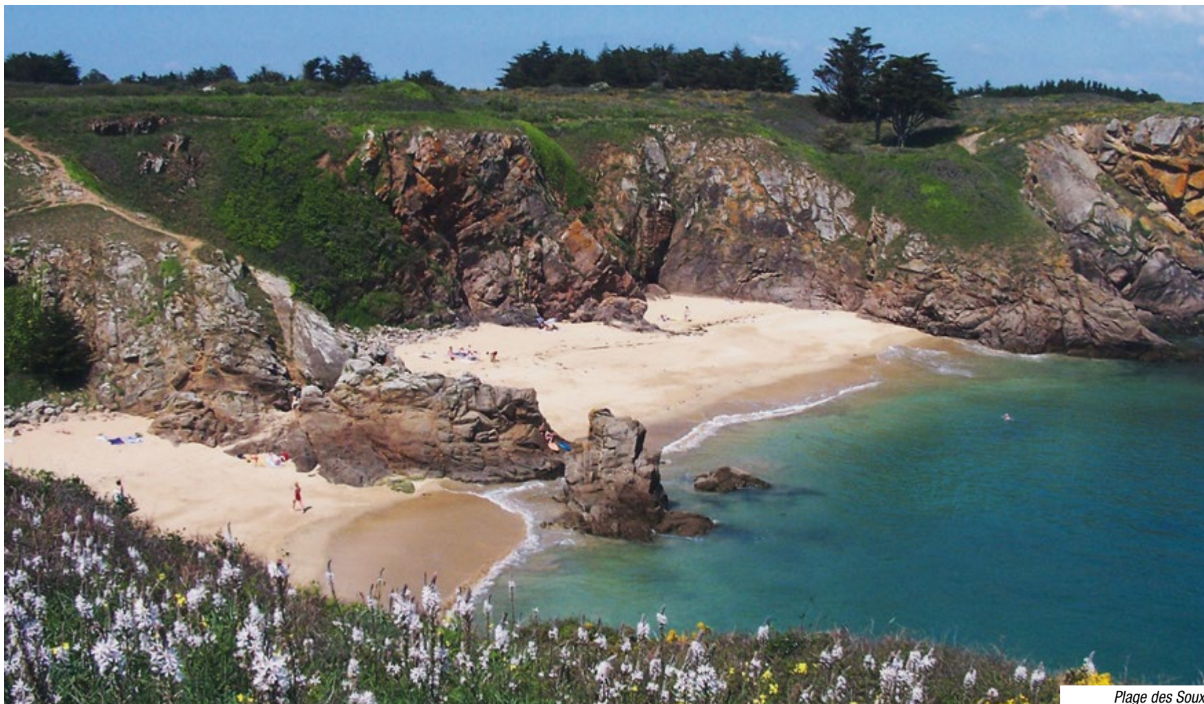
Plage des Soux