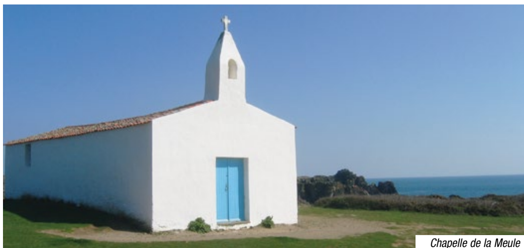
Chapelle de la Meule

Toutes les infos sur ile-yeu.fr - Vénètes, coup de coeur assuré !