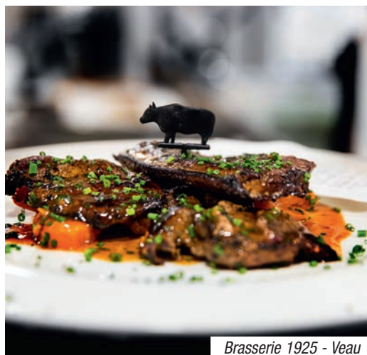
Brasserie 1925 - Veau