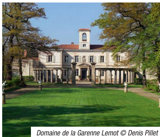
Domaine de la Garenne Lemot

Au XIXe siècle, le projet un peu fou de la Garenne Lemot devient réalité. Dans un parc boisé, un paysage idéalisé distribue bâtiments à l'italienne, statues antiques et petits temples. A l'entrée du domaine, la Maison du Jardinier est un petit chef-d'oeuvre de l'architecture rustique transalpine. Dans un style néoclassique, la Villa Lemot avance son belvédère au-dessus de la Sèvre.