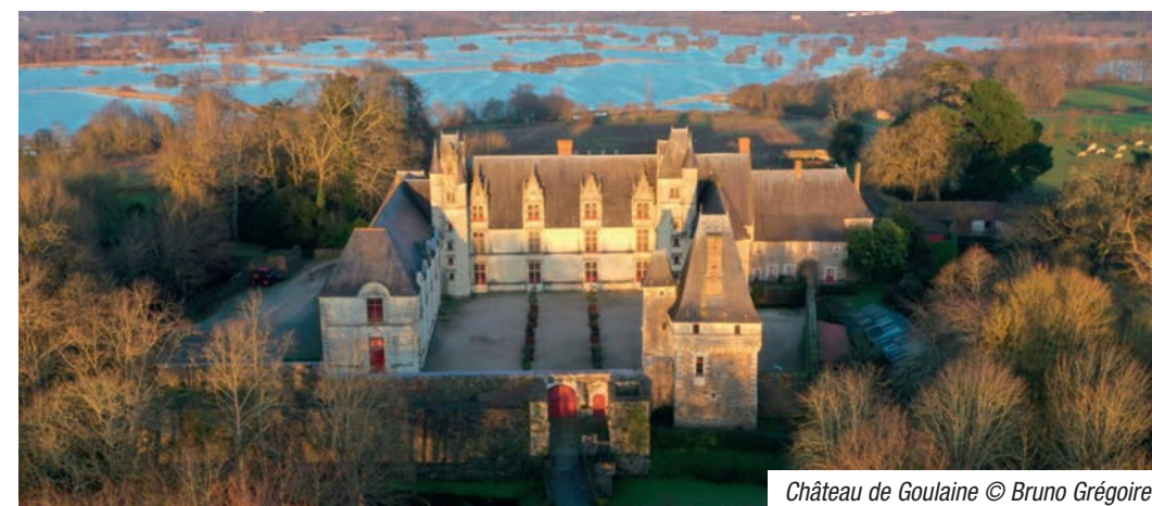
Château de Goulaine

Pour profiter de tout cela vous pouvez prendre le temps de dormir au château, l'occasion unique de profiter d'un couché de soleil sur le vignoble depuis une chambre renaissance authentique.