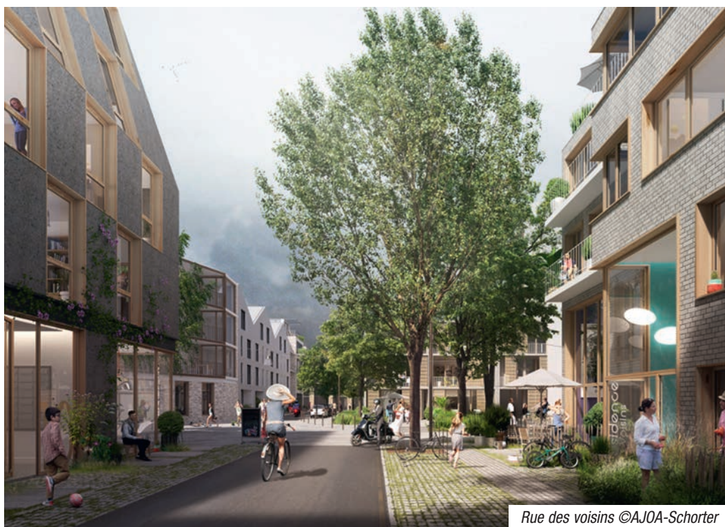
Rue des voisins