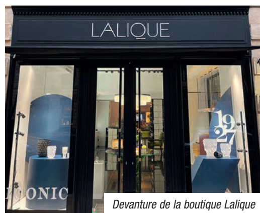
Devanture de la boutique Lalique

Marque de luxe dont les boutiques sont rares (il n'y en a pas à Nantes), et à priori élitistes, vous trouverez un bar dans la boutique de Bordeaux, légitime car la maison Lalique possède un domaine et peut donc présenter ses propres vins, avec bouteilles spécifiques, une idée cadeau raffinée et accessible.