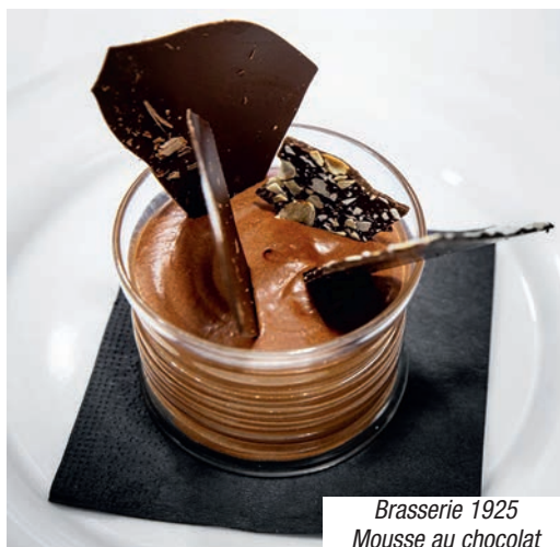
Brasserie 1925 Mousse au chocolat

Office du tourisme de Bordeaux : www.bordeaux-tourisme.com