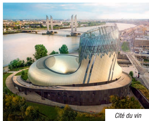
Cité du vin

LES TOILETTES LES PLUS PROCHES* SONT PAR ICI