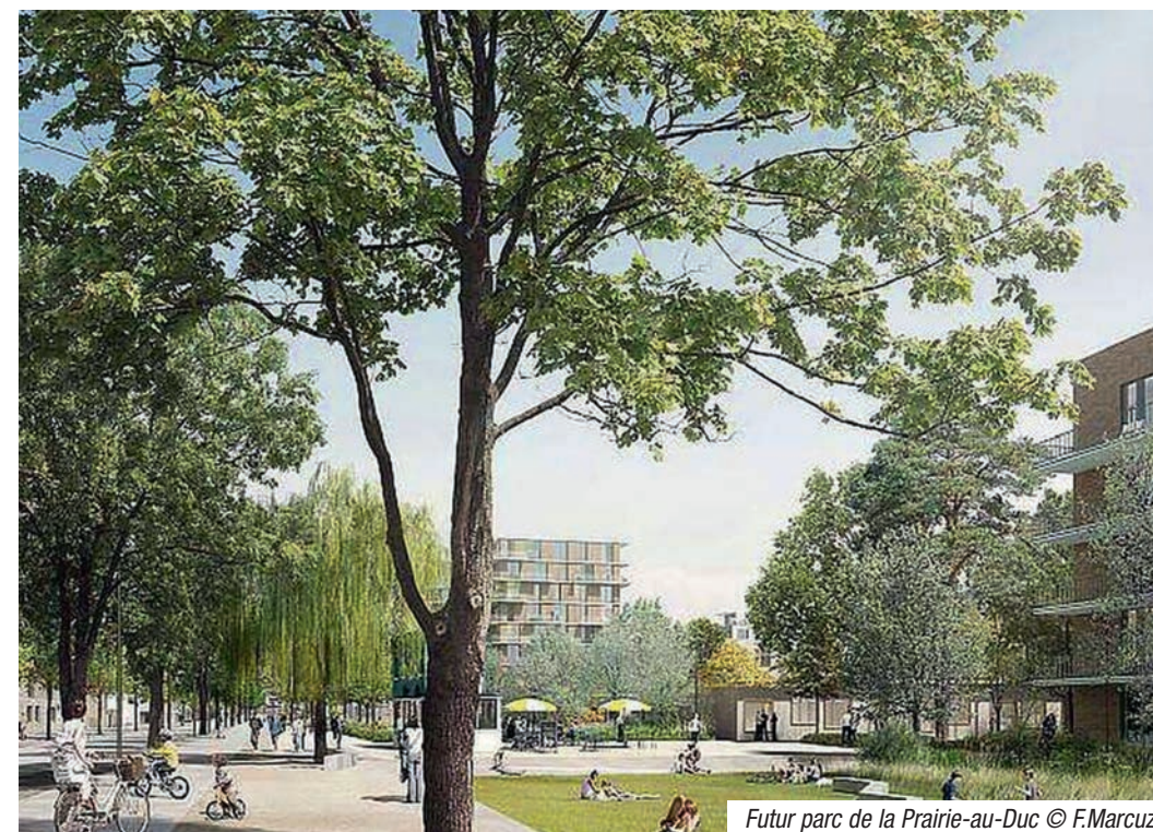
Futur parc de la Prairie-au-Duc

Pour accompagner la conception du projet d'aménagement du nouveau quartier République, un atelier citoyen s'est mobilisé au printemps 2018. A l'issue de deux journées de travail autour du thème du bien-être en ville, les 34 participants ont ainsi remis un carnet de préconisations citoyennes sur lequel l'équipe de maîtrise d'œuvre conduite par Jacqueline Osty et Claire Schorter a pu s'appuyer pour finaliser son projet.